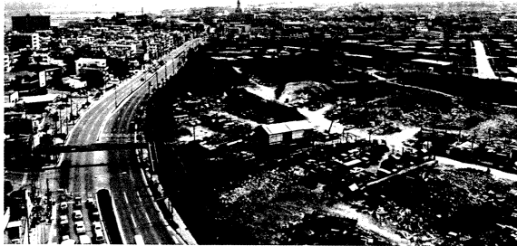
昭和62年5月31日付で全面返還される牧港住宅地区

沖縄県における軍用地賃貸料については、軍用地等関係地主の殆どが賃貸料を生活の根源として、地価の変動のほか、物価上昇等も勘案のうえ、毎年適切な増額改定の措置を要請しているところであり、昭和六十二年度の沖縄県関係の施設借料予算額として、四億二千億八千万円の予算措置を強く要請することとした。 要請実現を期するため、昭和六十二年七月十四日から五日間の日程で、徳元会長は、全役員