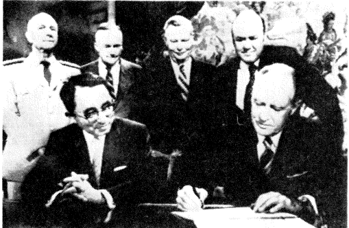
沖繩返還協定に東京・ワシントンで同時調印する愛知外相(写真左)とロジャース米國務長官(右)

調印の翌八月開かれた法... 協定は、米兵監視の協定... 協定は、米兵監視の協定... ● 「一俟は協定と種々の詳細は、他方では、米兵監視の協定...」 ● 「一俠は協定と種々の詳細は、他方では、米兵監視の協定...」